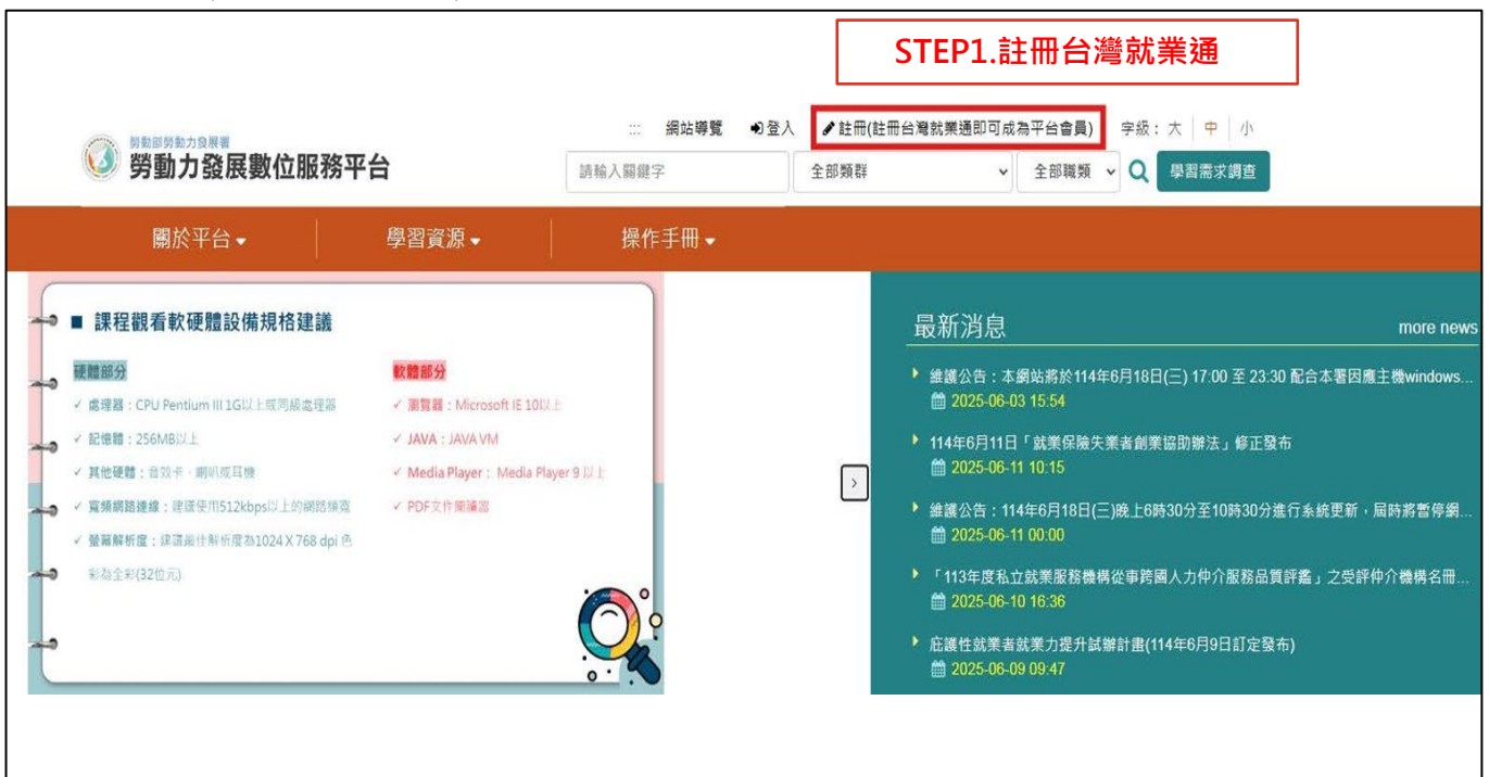
圖 2. 請以瀏覽器連結至「勞動力發展數位服務平臺」點選註冊 ( https://portal.wda.gov.tw/mooc/index.php )