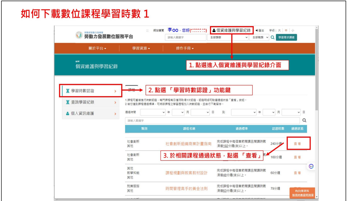
圖 7. 完成課程後，請至個資維護與學習紀錄操作