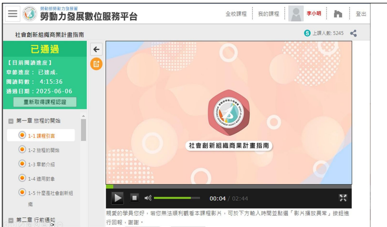
圖 6. 數位課程授課畫面