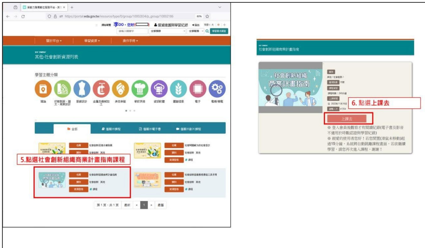
圖 5. 進入課程頁面，點選上課去