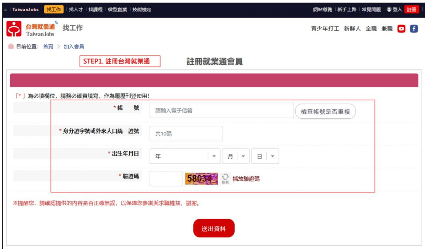
圖 3. 完成「註冊就業通會員」取得會員帳號