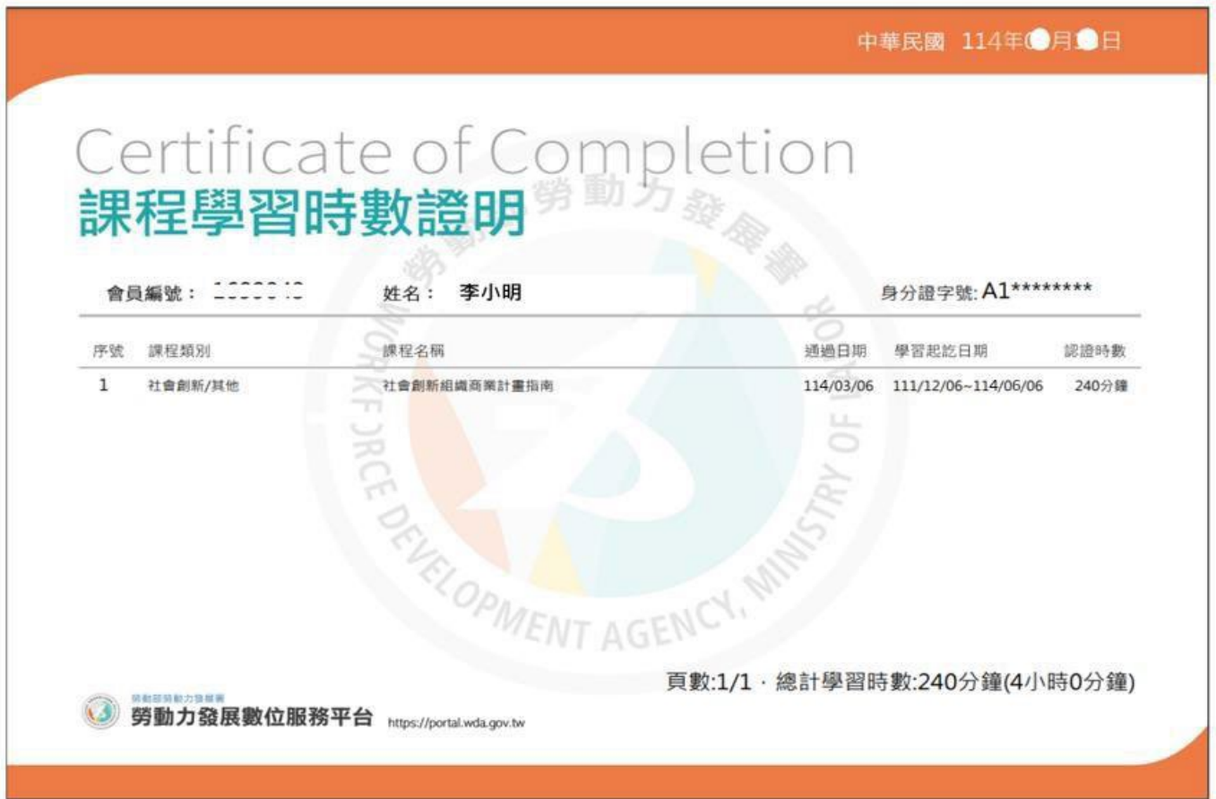
圖 1. 檢附數位課程學習